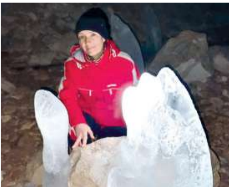
фото на фоне подсвеченных сталагмитов получились отличные.